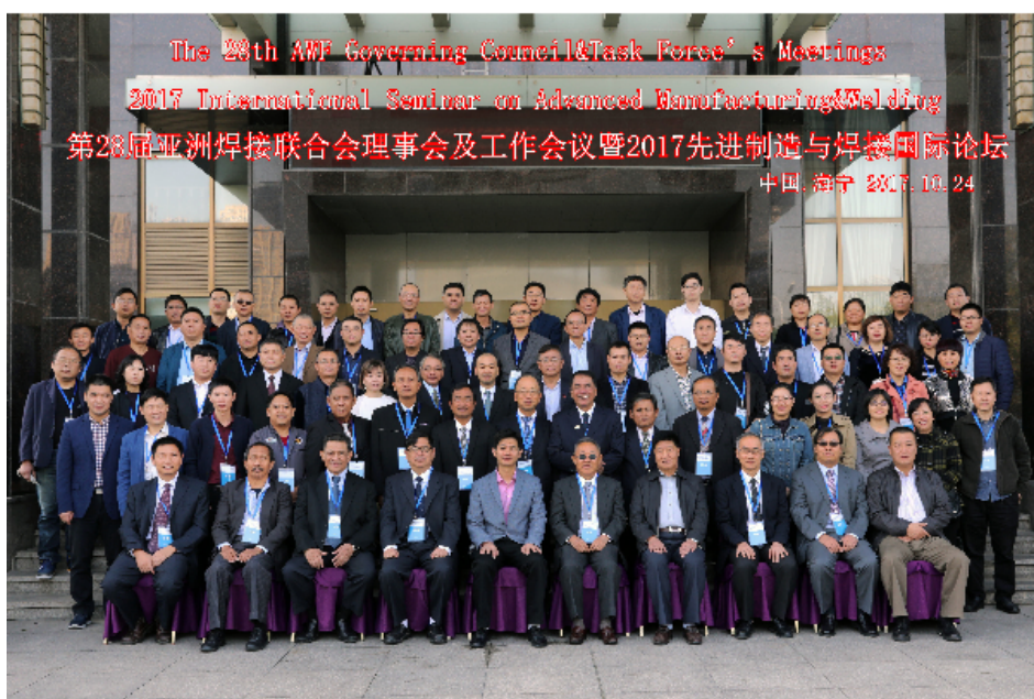
全体会议代表合影

的最好的一届。与会代表纷纷以微信和邮件等多种形式，对中国焊接学会卓有成效的工作和周到细致的安排给予了充分肯定，表达了诚挚感谢。